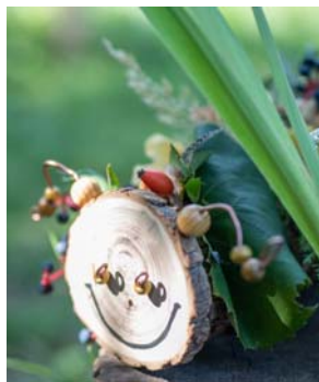
TVORIVÉ SETY PRE DETI