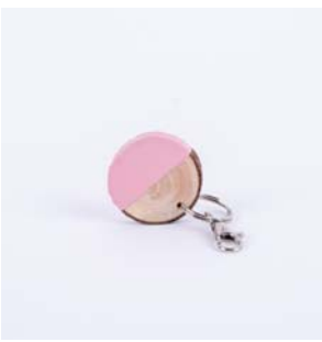
REKLAMNÉ PREDMETY A DARČEKY